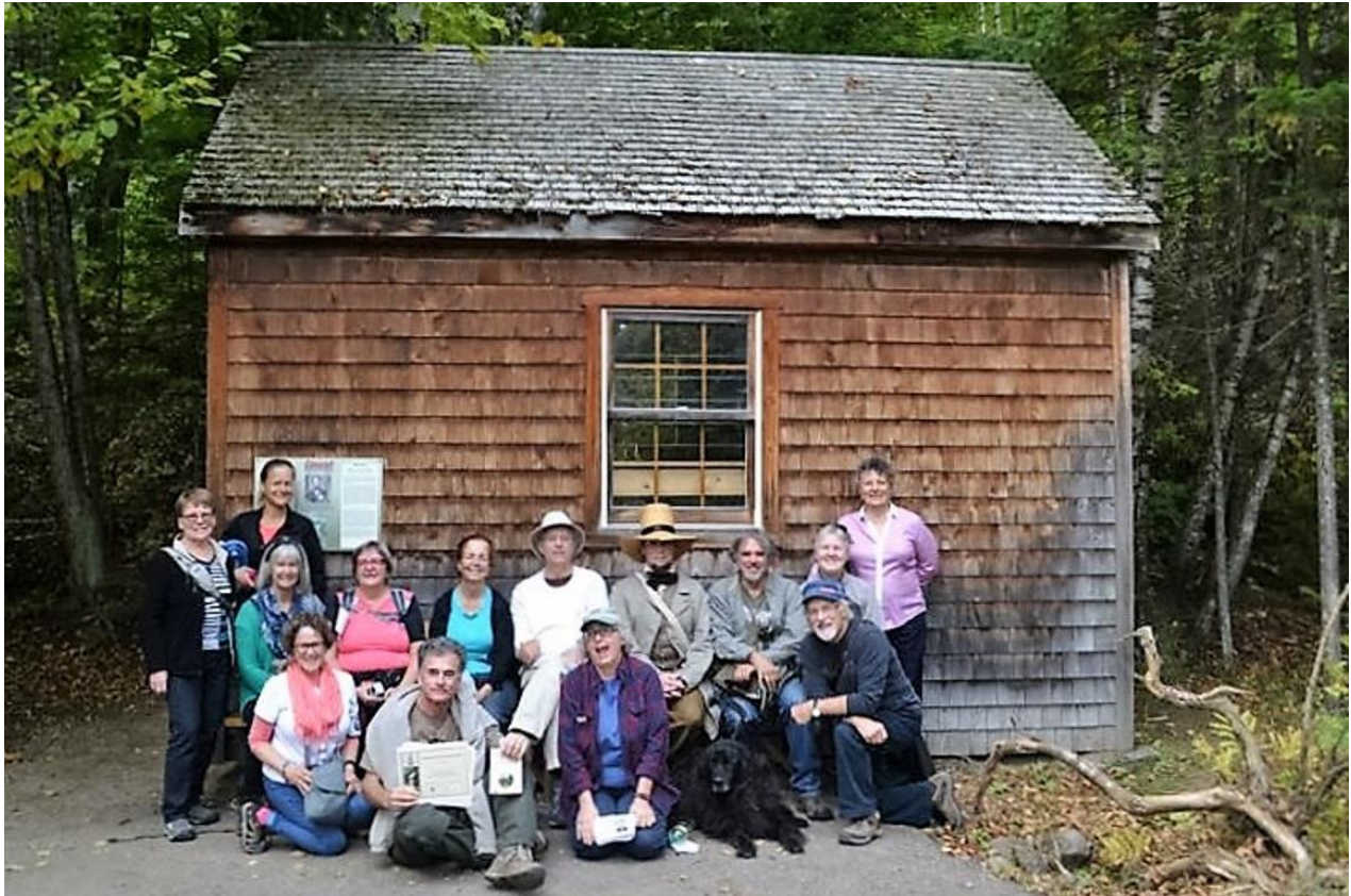
La réplique de la cabane de Thoreau lors de notre marche « Sur les traces de Thoreau » en 2016